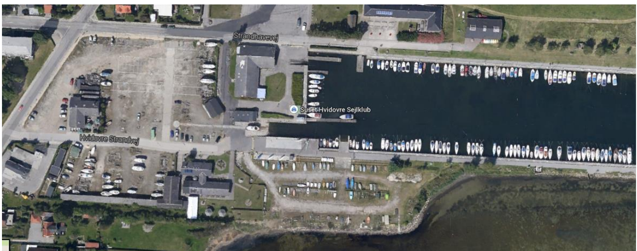
Luftfoto – Hvidovre Havn

Plads til opbevaring af udstyr forefindes på havnen, og kan aflåses.